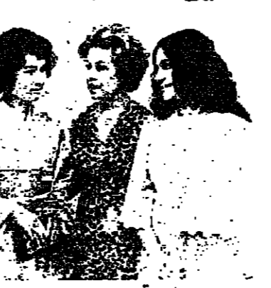
هنا كان المهرجان